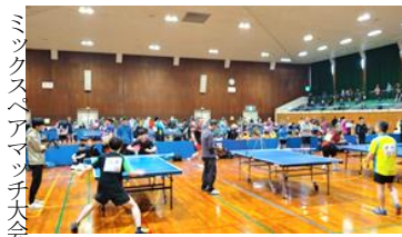
ミックスペアマッチス大会

第54回ペアマッチス大会 5月3日、若松体育館で開催。男子172名、女子176名。白熱する試合は見ごたえがありました。