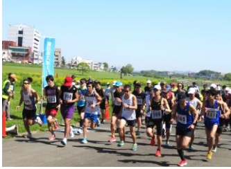
第80回月例10kmのスタート

参加者88名、スタッフ16名。第1回の水巻町会場から今回が8年目の80回目。初夏の陽気のもとでの開催となりました。ゼッケンも1000番台になりました。新規登録者は25名、登録者総数は1008名。※77回、79回は中止。