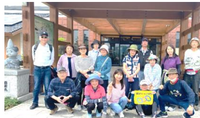
4月例会方城温泉「ふじの湯の里」

参加者17名。今月は上野焼や興国寺知られる福智町を歩くコース。春の陶器祭りと重なり展示場では個性豊かな皿やお茶の道具が。歩き疲れたところがお目当ての方城温泉「ふじの湯の里」。身体を癒してくれました。